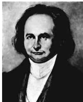
Fonctions sn et cn